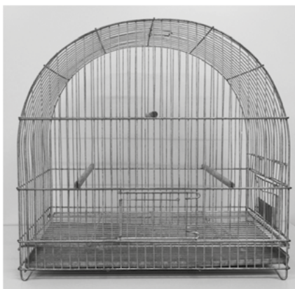
Figura 1 A – Modelo da gaiola padrão para torneios de Canto Livre (Canários domésticos) Vista frontal

10.1.1. A Gaiola deverá conter ao menos um comedouro transparente com alimentação comum a canários domésticos e um bebedouro transparente com água potável, sendo proibido qualquer outro produto misturado a água.