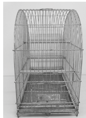
Figura 1 B – Modelo da gaiola padrão para torneios de Canto Livre (Canários domésticos) Vista lateral