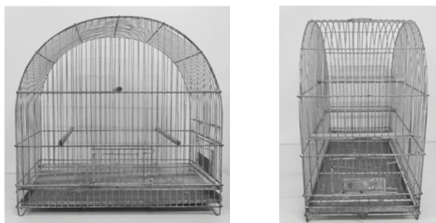
Figura 1 A – Modelo da gaiola padrão para torneios de Canto Livre (Canários domésticos) Vista frontal

6.1. As gaiolas deverão seguir um mesmo padrão estabelecido.